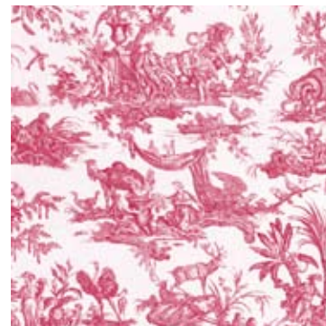
Les Quatre Parties du Monde

Fruit d'une rencontre de passionnés: un industriel spécialiste des tissus « outdoor » et de l'équipe Toiles de Jouy l'Authentique, l'édition des « Quatre Parties du Monde » sur un support 100% acrylique, résistant aux intempéries (certifié Tempotest®), constitue une véritable prouesse, aussi bien technique qu'artistique.